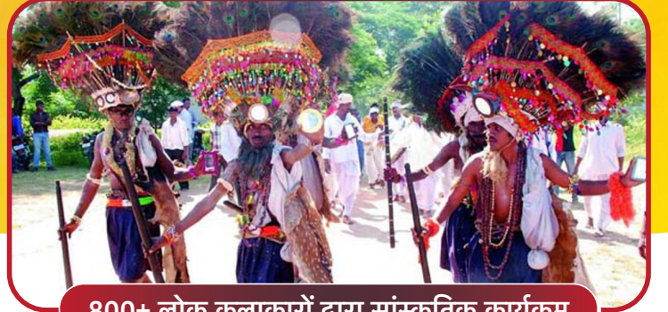
800+ लोक कलाकारों द्वारा सांस्कृतिक कार्यक्रम