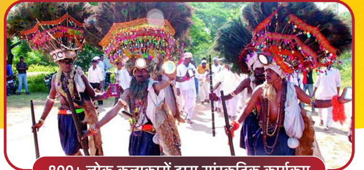
800+ लोक कलाकारों द्वारा सांस्कृतिक कार्यक्रम