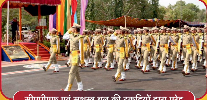
सीएपीएफ एवं सशस्त्र बल की टुकड़ियों द्वारा परेड