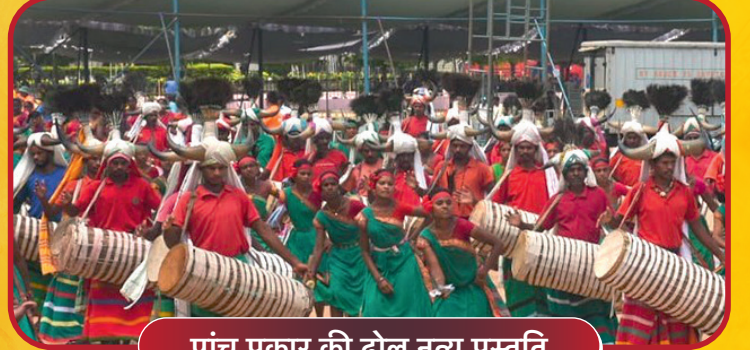
पांच प्रकार की ढोल नृत्य प्रस्तुति